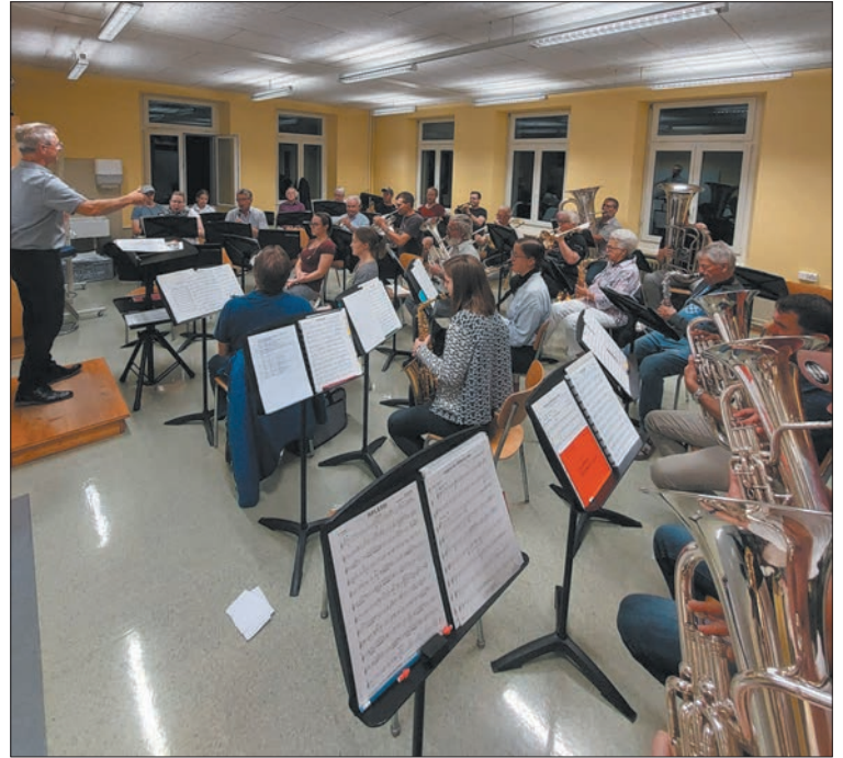
Volle Konzentration bei den Proben – Jungmusizierende mit erfahrenen Musikanten.

«Sonne und Mond» und lässt ein vielversprechendes Programm entlocken. Mit heiteren, wärmenden Sonnenstrahlen und geheimnisvollen, mystischen Mondspiegelungen entführen wir Sie in verschiedene Welten der musikalischen Vielfalt – lernen Sie die Sonne und den Mond von ihren musikalischen Seiten kennen. Freuen Sie sich auf tragende und mächtige Melodien, berührende Solis, unterhaltende Werke mit Überraschungseffekt sowie bekannte Musikstile. Seien Sie gespannt, welche musikalische Leckerbissen wir für Sie bereithalten – wir freuen uns auf Ihren Besuch. Im Anschluss an das Konzert schenken wir frisch gebrühten Punsch und Glühwein aus, um gemeinsam mit Ihnen auf eine besinnliche Weihnachtszeit und ein frohes neues Jahr anzustossen. Bis bald, Ihre Musig im Dorf.